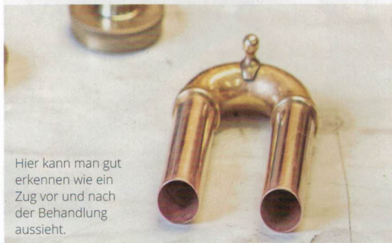
Hier kann man gut erkennen wie ein Zug vor und nach der Behandlung aussieht.