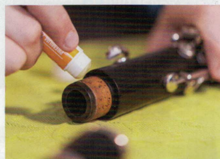
Gönne deinem Instrument ein Pflegeprogramm.

von Experten aus dem Musikhaus Schagerl und Votruba zusammengetragen, um diesen Gefahren entgegen zu wirken und das eine oder andere Wiedersehen mit seinem Instrument frühzeitig zu fördern.