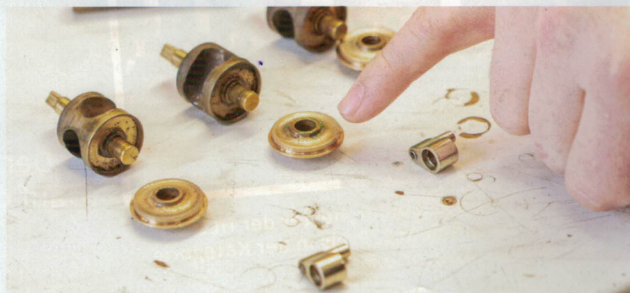
Nicht nur zu viel Spielen kann Spuren hinterlassen.