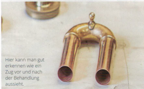
Hier kann man gut erkennen wie ein Zug vor und nach der Behandlung aussieht.